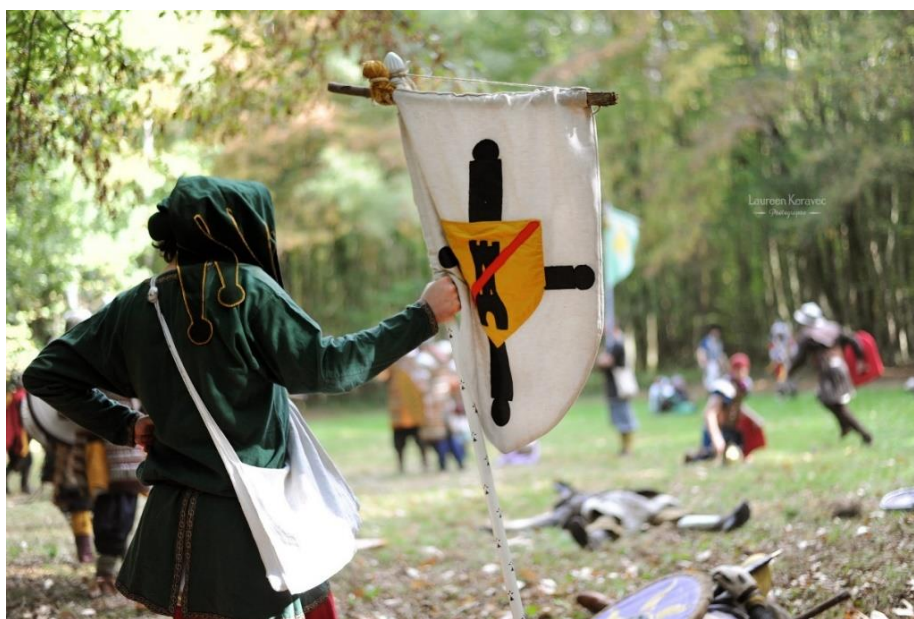
Figure 1 : Emblème des Joyeuses Compagnies

Nous espérons que ces conseils vous aideront à trouver l'inspiration et à créer un costume qui reflète l'esprit de cette époque !